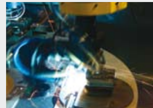
Das Lasern von Röhrenradiatorköpfen

Obwohl die hohe Präzision des Prozesses das anschließende Beschleifen im Grunde erübrigt, findet ein leichter Überschleif statt. Für höchste Oberflächenqualität und perfektes Finish.