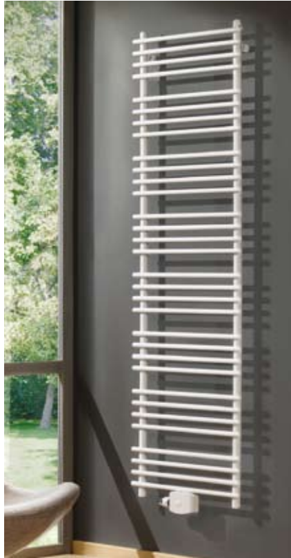
Cobolo 1, Cobolo 2 Komfort-BADWÄRMER BEMM

Praktisch, weil sowohl Aurea 1 (s. Abb.) als auch Aurea 2 dank der außermittigen Anordnung ihrer Sammelrohre eine flexible Zweiseitigkeit bieten, so dass der Benutzer größere Handtücher auf den längeren und kleinere Handtücher auf den kürzeren Schenkel hängen kann. Bei der Montage lässt sich die längere Seite sowohl links als auch rechts positionieren.