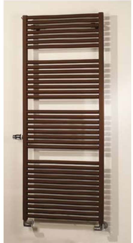
Rondo V Ventil-BADWÄRMER BEMM

Cobolo 2 bietet durch seine doppelreihig angeordneten, horizontalen Querrohre eine höhere Wärmeleistung. Für eine leichte Pflege hat Cobolo weite Rohrabstände.