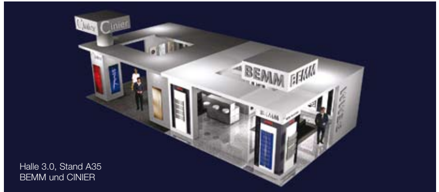
Halle 3.0, Stand A35 BEMM und CINIER

In der neu aufgeteilten Halle 8.0 zeigt BEMM zusammen mit der auf Seite 2 vorgestellten Firma IRSAP auf über 200 m 2 sein Raumwärmer-Programm aus lasergeschweißten Röhrenradiatoren, Paneelkonvektoren und Paneelheizwänden bis hin zu Kreuzrohr-, Lamellen- und Einsäuler-Radiatoren sowie Aluminium-Heizpaneele. Neu sind dabei die Planheizwände Plawa, die auch mit Edelstahl-Oberfläche und mit Lichtapplikationen zur Verfügung stehen, sowie die „goldene“ Serie Aurea, die „bequeme“ Serie Rondo V und die „geradlinige“ Serie Cobolo.