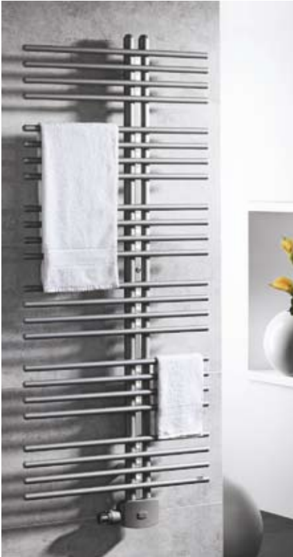
Aurea 1, Aurea 2 Top-BADWÄRMER BEMM

Als Weiterentwicklung des Samba 1 ist der sowohl für Zentralheizungen als auch für Elektrobetrieb konzipierte BEMM-Top-Badwärmer nicht nur schön, sondern auch praktisch.