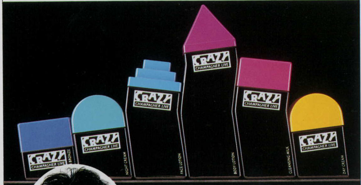
コスメティック・シリーズ「クレージー」