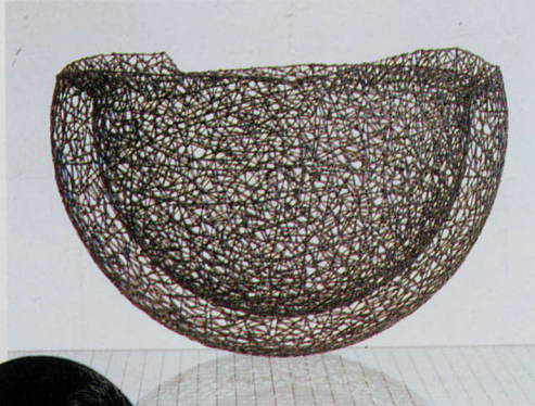
網状に溶接された1ミリのワイヤー 91年製作