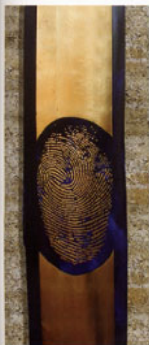
Wandbild mit vergoldetem Fingerabdruck