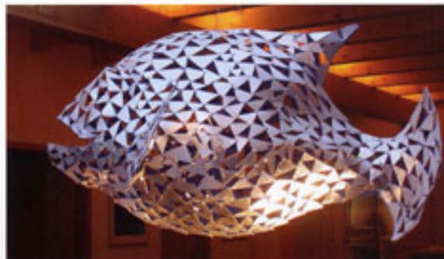
Von außen beleuchtet, wirft dieser Fisch aus Stahlblech das Licht in alle Ecken des Raums