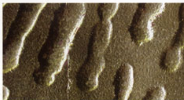
Keine kleinen Würmer, sondern das Detail eines vergoldeten Fingerabdrucks auf Kupferfolie