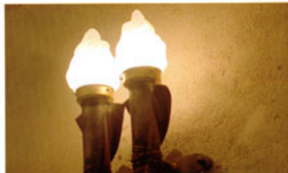
Diese Fackeln rußen nicht - geschmiedete Wandleuchten im «Zelt des Maharadschas»