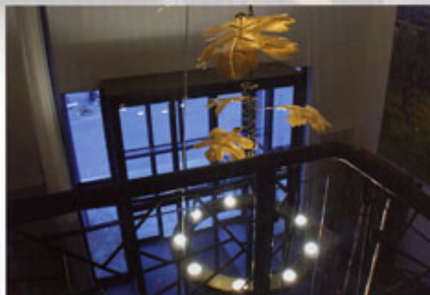
Die metallenen Weinblätter des Leuchters (ganz oben) werden von unten angestrichit